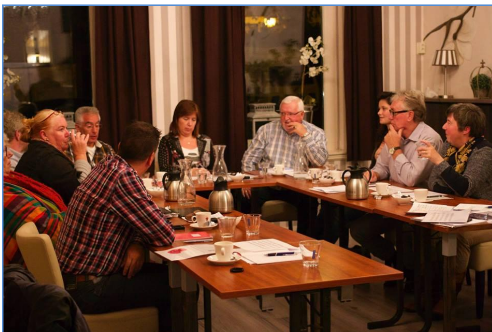
Leden van de Wmo-raad tijdens de trainingsavond september 2014

Kortom, het is een druk en wederom boeiend jaar geweest waarvan wij in ons jaarverslag een kort beeld schetsen. Wij hopen u met ons jaarverslag een indruk te geven van ons werk en de inhoud waar we ons mee bezig hebben gehouden.