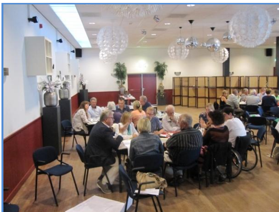
Informele kennismaking en gesprekken per kern tijdens de bijeenkomst van 17 juni 2014